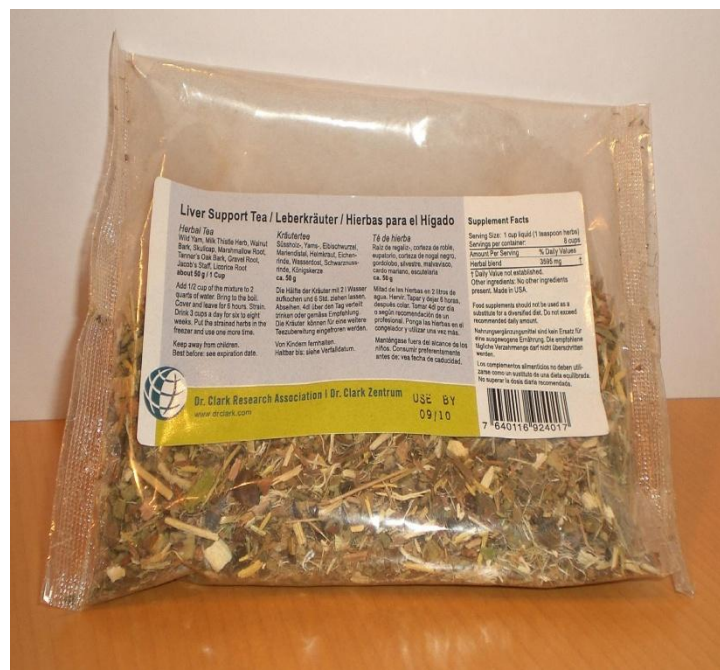
Liver Support Tea